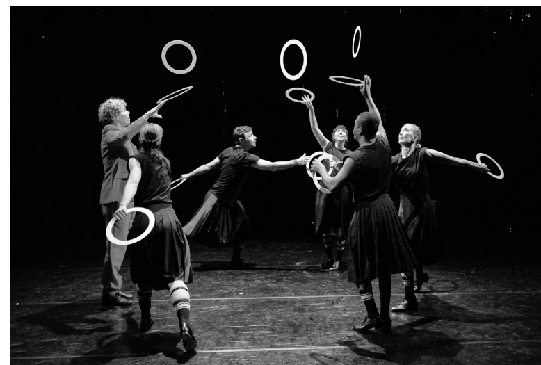
Heka, Gandini Juggling